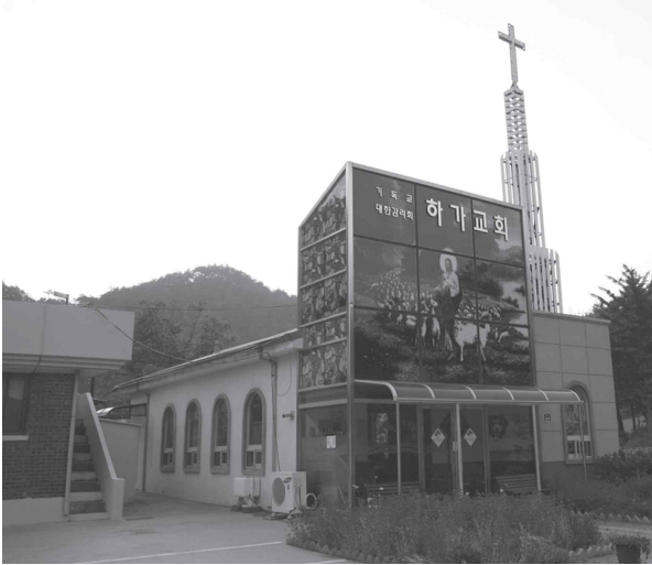
산양2리 하가마을 내 하가교회