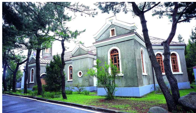
그림 2 앱스 및 우측면(제구실) 전경