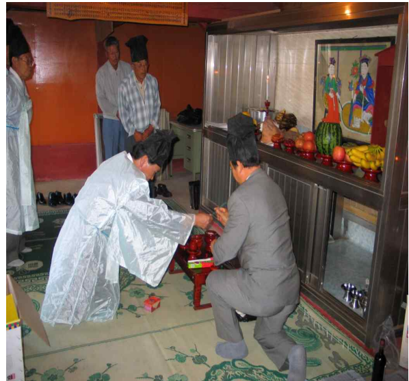
삼척 읍치성황사에서의 성복동 성황제

여기서 삼척에서 행해진 오금잠제에서 주목하여야할 요소는 지방의 향리나 지역 주민들이 이에 적극 동참하고 있으며, 단오를 전후하여 제사를 지내고, 신상(神像)을 받든다는 점이다. 구체적으로 각 지역별 성황신의 성격은 인간 기원신 · 전통적인 산신(山神) · 동물신 · 주물(呪物)을 모신 사례 등 매우 다양한데, 삼척 성황사에서 오금잠을 받들어 제사를 지내는 것은 다양하게 나타나는 성황신의 모습들 중 주물(呪物)을 모신 사례로서 이해될 수 있다. 국가에서 공식적으로 읍치 성황사를 설치하기 전에 이미 이 지방에서의 전통적인 신앙 관념이 존재하였다는 것을 알 수 있다. 다만 비공식적으로 향리와 지역민 등에 의해 매년 제사가 거행되는 과정에서 폐단이 심하여 결국 지방관들이 이를 금하는 조치를 내렸다고 볼 수 있다.