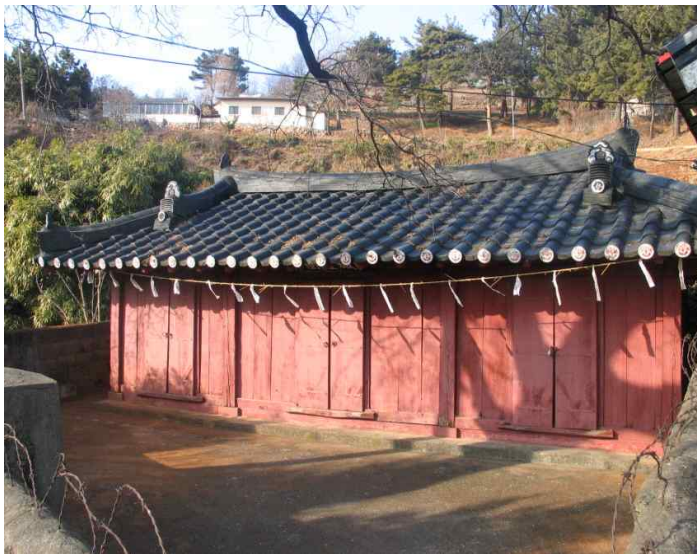
삼척 읍치성황사 근경

둘째는 무사귀신을 위무하고 역병을 방지하기 위해 여단을 설치하였는데, 여제를 지내기 3일 전에 성황사에서 성황발고제를 지내어 여제 지냄을 알리는 역할과 함께 여단의 중앙에 성황신위를 모심으로서 여제를 주관하는 신으로서의 역할을 하였다. 삼척의 성황사도 이와 같은 역할을 하였다.