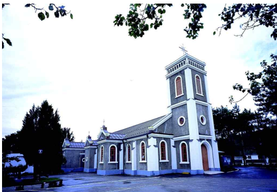
그림 1 천주교 성내동 성당 전경