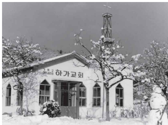
산양2리 옛 하가교회 2