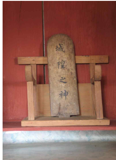
삼척 읍치성황사내 성황신위

삼척 성황사는 고려말인 홍무 25년(공양왕 4년)에 전국적으로 성황사를 설치하여야한다는 지침에 의해 설치된 것으로 보인다. 이와 같이 설치된 성황사는 수 차례에 걸쳐 성의 안과 진산인 갈야산으로 반복 이동해오다가 1908년 전국적으로 읍치 성황사를 폐한 이후 삼척의 성황사도 읍치 성황사로서의 위상이 없어지고, 성황사 주변 마을 주민들에 의해 유지되다가 이유는 확실치 않지만 1922년에 두랑산에서 현재의 위치인 갈야산 기슭으로 이전한 이후 4차례 중수를 하여 오늘에 이르고 있다.