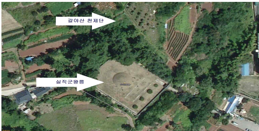
그림 11 갈야산 천제단 위치

강원도 삼척시 성내동 천제단은 삼척의 읍치성황사가 위치한 진산인 갈야산 중턱에 있는데, 마을 사람들은 천제단이라 부른다. 흙담을 ㄷ 자형으로 쌓아 그 내부에 흙 제단을 만들었으며, 제일은 정월 초하루 자시이다. 축문에 따르면 모시는 신령은 城隍之神·癘疫之神·土地之神이며, 제수는 떡 3시루, 소머리, 해물, 전, 삼실과 각 3그릇, 제주 3단지이다.