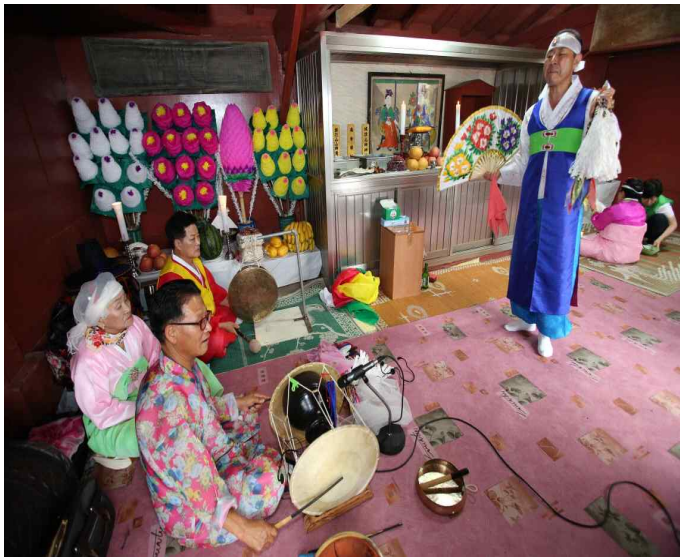
삼척 읍치성황사에서의 오금잠제

그리고 조선시대에 읍치성황사를 운영하면서 단오에 오금잠을 모셔놓고 제의를 지냈다는 기록이 여러 문헌에서 발견되고 있다. 삼척의 오금잠은 조선 이전부터 있어왔던 것으로 부사 정언황, 김효원 등이 계속 폐하고 없었으나 이들 부사가 물러난 이후에도 허목과 채제공이 계속 보았다고 하는 것으로 보아 없어지지 않고 삼척 사람들에게 계속 신봉의 대상이 되었음을 알 수 있다. 이로보아 조선 중기이후 삼척에 파견된 부사들이 성황당의 미신을 혁파하고, 유교적 질서를 확립하겠다는 목적과 함께 무당 의 민폐 제거, 세금 징수라는 측면에서 없앴으나, 민간에서는 계속 전승되고 있었음을 알 수 있다.